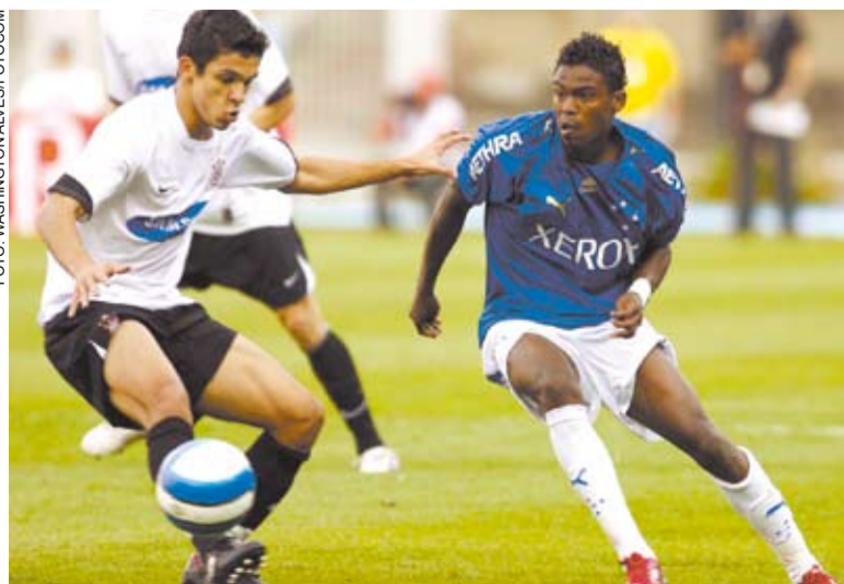
Everton (e) tem sido um dos destaques do Corinthians no Brasileirão

Após a saída do contestado Emerson Leão, Paulo César Carpegiani chegou com a missão de reerguer o Corinthians. Logo de cara, viu o time cair diante do Náutico na Copa do Brasil. Em apenas dois jogos no Campeonato Brasileiro, no entanto, o treinador acertou a marcação e foi capaz de dar um novo padrão tático à equipe.