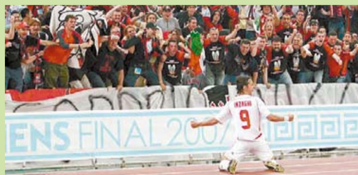
VALORIZAÇÃO DA MARCA - Inzaghi faz dois na vitória sobre o Liverpool, garante título da Liga ao Milan e valoriza ainda mais o clube italiano.

Surpresa na convocação de Dunga, Afonso Alves, atacante do clube holandês Heerenveen, viu o valor de seu passe 'subir' da noite para o dia. Eleito o jogador do ano na Holanda e prestes a ganhar a Chuteira de Ouro como o maior artilheiro da Europa na temporada, com 34 gols marcados, o mineiro que saiu cedo do Brasil por não ter chances no Atlético-MG custou apenas R$ 3 milhões. Hoje, seu passe está avaliado em R$ 60 milhões. Vários clubes de ponta já estão interessados.