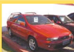
Fiat Marea Weekend Turbo1999 / Completa + Couro R$ 24.900,00