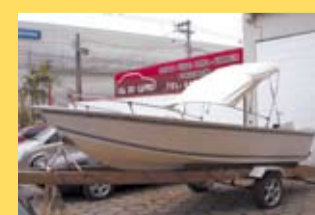
Barco Marajo 16 1992 Jonhson 45 Force Dir. Part. Elet. Doc. OK C/ carreta R$9.000,00 Fone: (11) 7336-0264