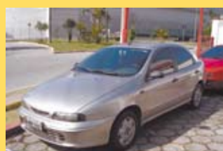
Fiat Brava SX 16 16V 2000 Completo Cia do Carro (11) 4195-4321