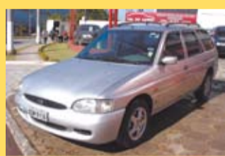
Ford Escort SW 1.8 16V 2000 AR, DH, Alcool R$ 16.900,00