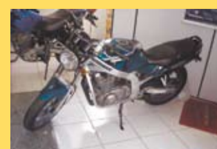
Suzuki GS 500 E 1999 R$ 11.900,00 Cia do Carro Fone: (11) 4195-4321