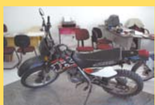
Honda XR 200 00/01 R$ 5.400,00 Cia do Carro Fone: (11) 4195-4321