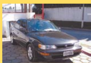
Toyota Corolla LE 1996 Completo + Couro e auto. R$ 14.900,00

Anuncie: (11) 3048-8905 comercial@jornalgiro.com.br • www.jornalgiro.com.br