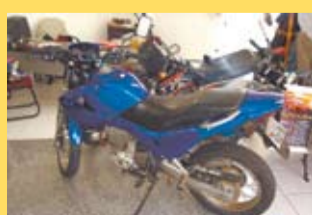
Honda NX-4 Falcon 99/00 R$ 8.500,00 Cia do Carro Fone: (11) 4195-4321