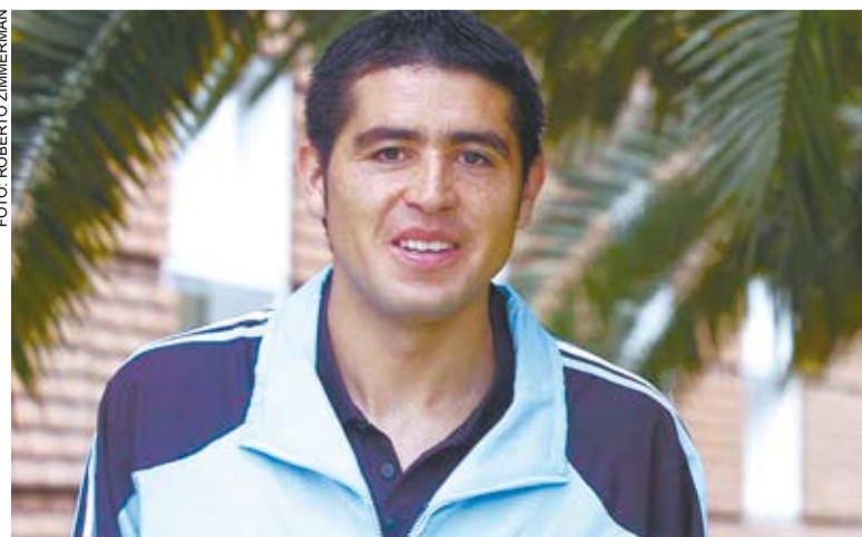
O meia Riquelme voltou a ser o grande maestro da seleção argentina