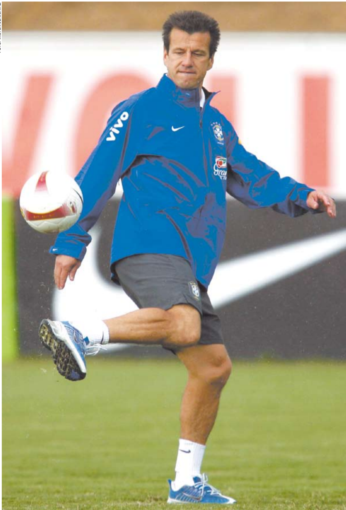
Dunga pode ganhar neste domingo seu primeiro título como técnico da Seleção Brasileira