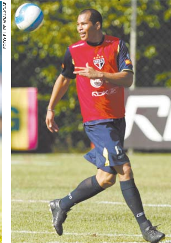
Finazzi só marcou dois gols até agora pelo Corinthians